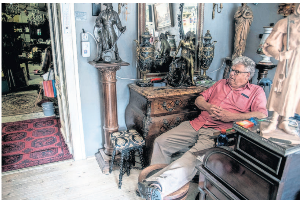
De eigenaar van een antiekwinkel in een loods aan de zijkant van een woonhuis. „De meeste spullen komen uit Lommel. Bij overlijden bellen ze mij.”

Aan de overkant van de straat is een winkel gevestigd. Op de lichtreclame staat onder andere: sigaretten, snoep en simkaarten. Er is niet veel veranderd. De soldaten