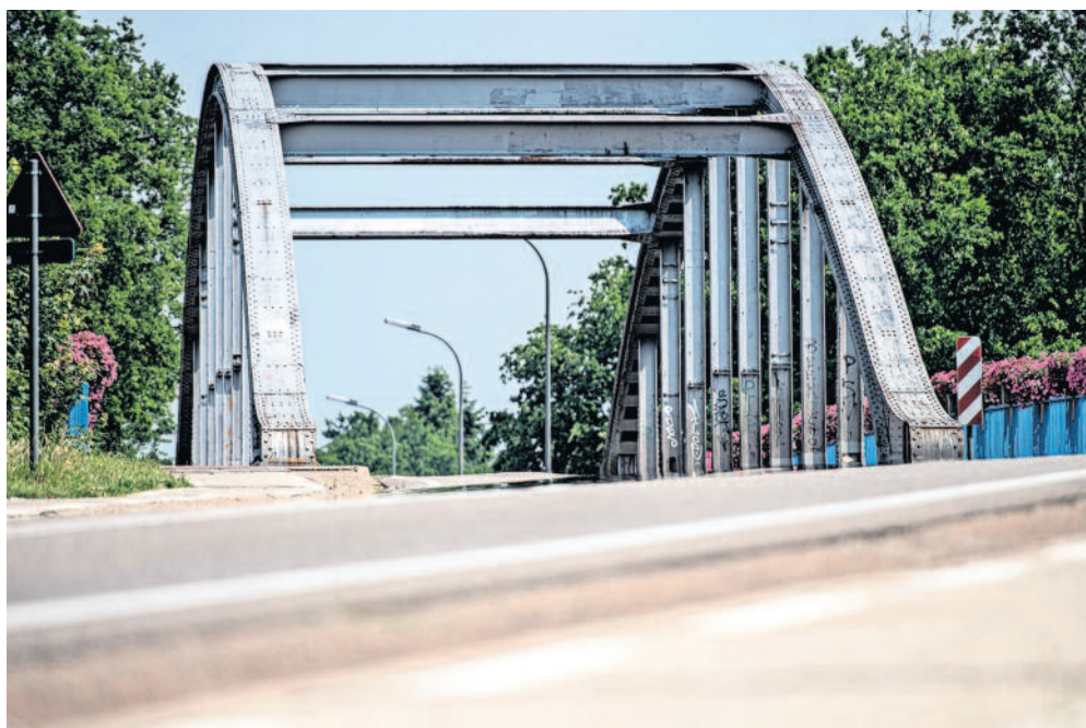
Joe's Bridge in Lommel. Alle 3000 voertuigen en 50.000 soldaten die meewerkten aan het grondoffensief zijn hier langs getrokken.

■ In een antiekwinkel in een loods aan de zijkant van een woonhuis zie ik een bajonet uit de Eerste Wereldoorlog voor 120 euro.