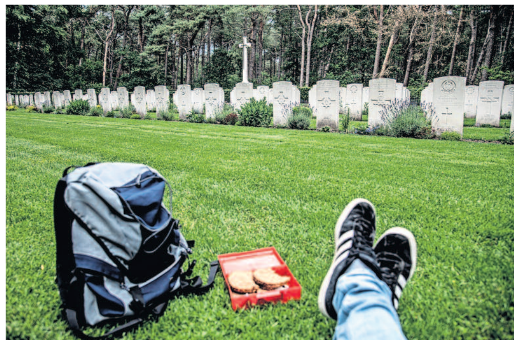
Het Valkenswaard War Cemetery. Iedereen had Arnhem voor ogen. Maar wie al omkwam bij de bevrijding van deze paar kilometer, bleef hier achter.